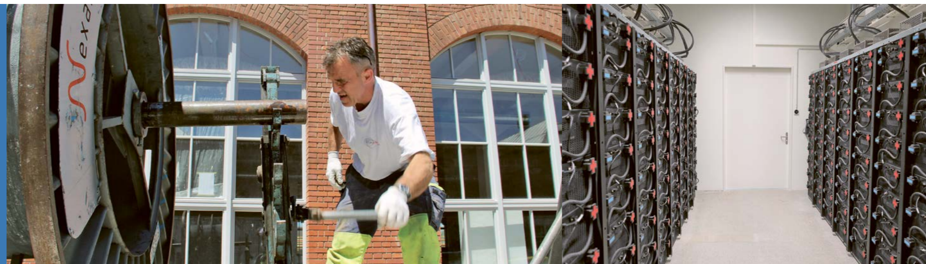
Bild links: 197 Kilometer Länge umfasst das Stromleitungsnetz von Arbon, das von Fachleuten fachmännisch betreut wird.

Die sichere Versorgung mit Strom, Wasser, Nahwärme und Telekommunikationsdiensten ist für die 30 Mitarbeitenden der Arbon Energie AG eine Daueraufgabe. Das stadtteigene Unternehmen investiert darüber hinaus in die Infrastruktur und in innovative Lösungen, um den wachsenden Ansprüchen der Kunden sowie des Gesetzgebers gerecht zu werden.